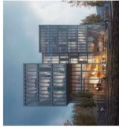
Illustrasjon - målestokk

OSLO METROPOLITAN UNIVERSITY STORSTUDENTETET