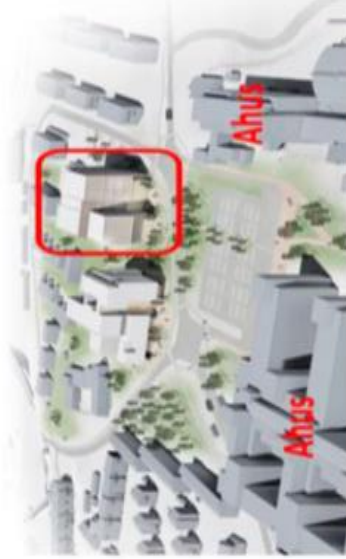
B. JENSEN arkitektur AS

Gode rammer for en tverrfaglig satsing på Intelligent Helse Et samlingspunkt for å møte regionens behov for helse- og teknologiutdanning