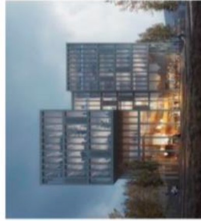
Illustrasjon - snuffebom

OSLO METROPOLITAN UNIVERSITY STORSTUNIVERSITETET