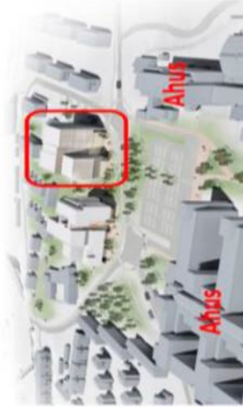
B. 605 arkitektur AS

Et samlingspunkt for å møte regionens behov for helseutdanning